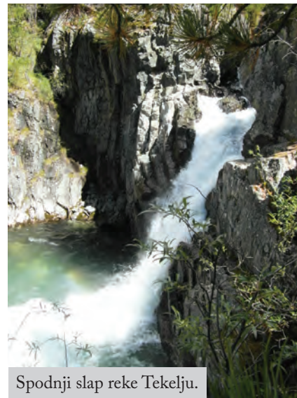
Spodnji slap reke Tekelju.