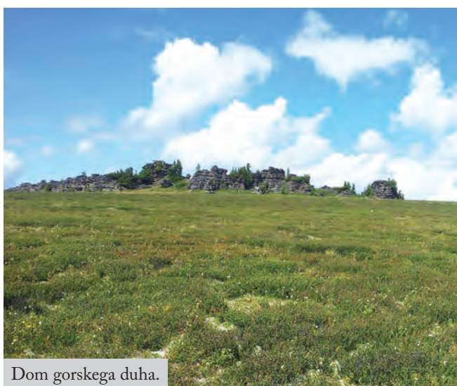
Dom gorskega duha.