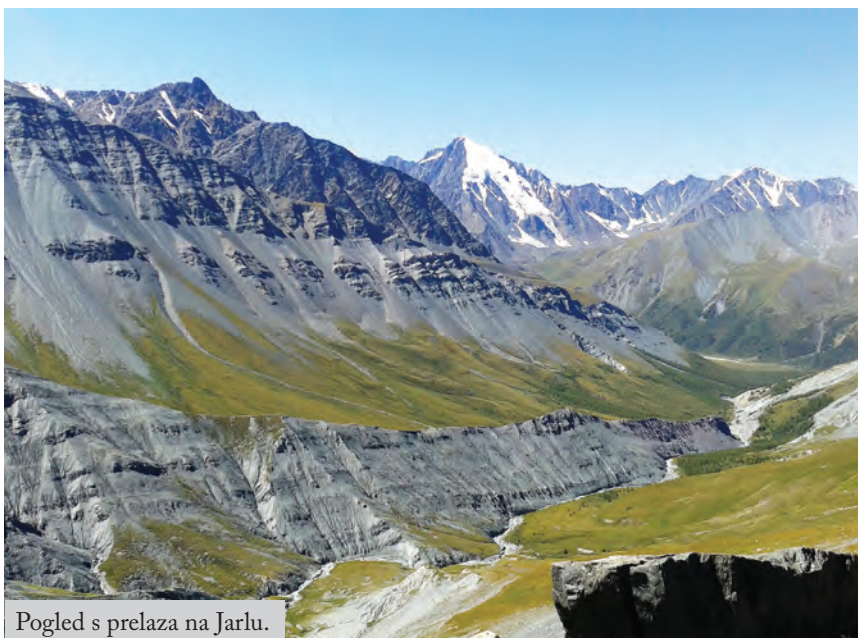
Pogled s prelaza na Jarlu.

Naslednji dan nas je pot vodila po bregu s številnimi izviri, ki tečejo po kamnitih koritih iz temnih skal. Pred nami so bile temne gore, pokrite s snegom. Eden od konj, Komarik po imenu, je skupaj z jahačico, ki ga ni dovolj spretno vodila, zašel