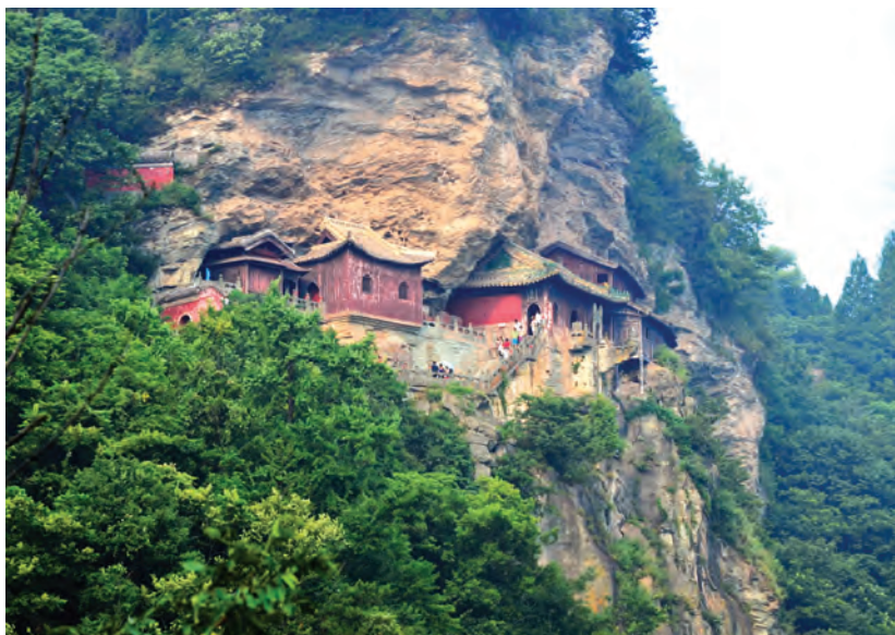
Viseči tempelj, Wudang.