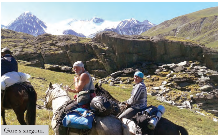
Gore s snegom.