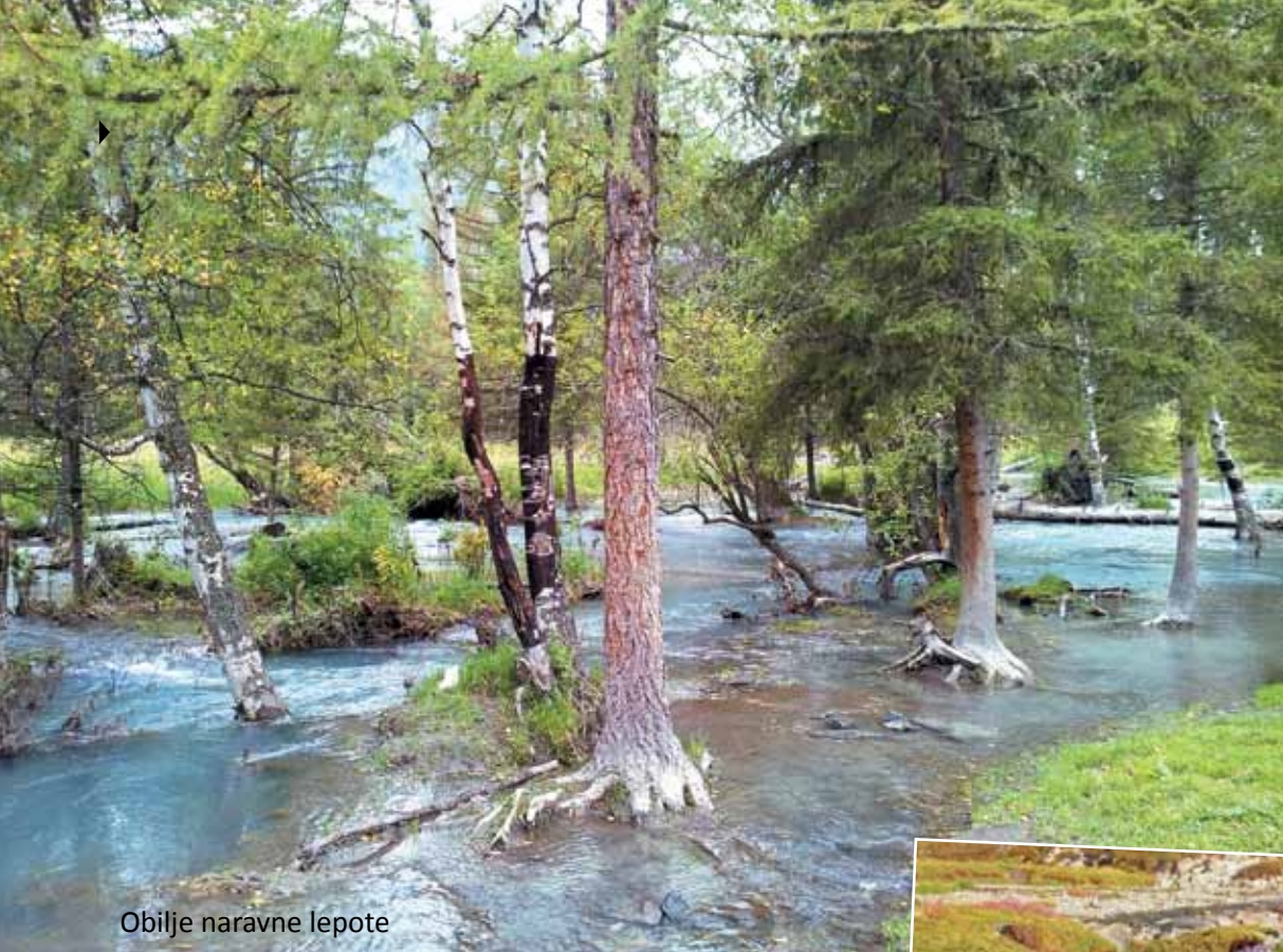
Obilje naravne lepote