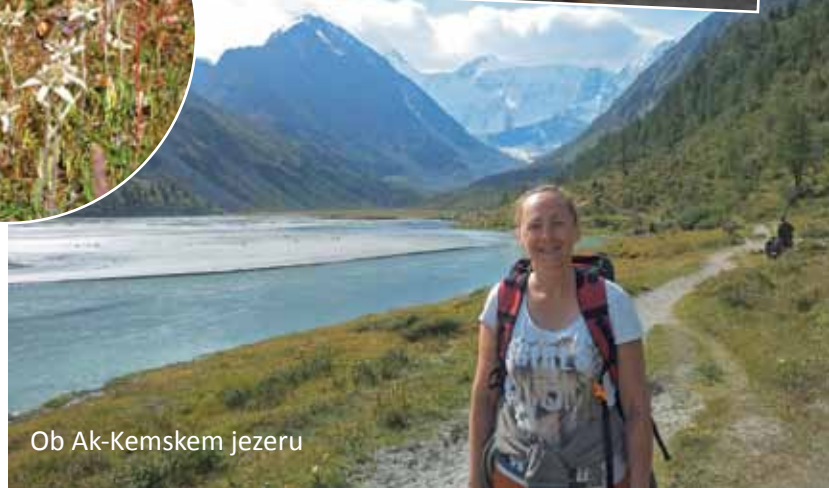
Ob Ak-Kemskem jezeru

na konja, vdana v usodo sem v koloni jahala v dolino, pot je bila spet lepša in lažja, trudila sem se slediti Komarikovemu ritmu in ga voditi. Ko smo prispeli v naš zadnji tabor, sem kot v transu postavila šotor. Hodila sem kot robot, nog sploh nisem čutila, stvari sem zvekla v šotor, se vsa vročična ulegla na spalno vrečo in utonila v spanec ... Prebudili so me klici k večerji, po vseh