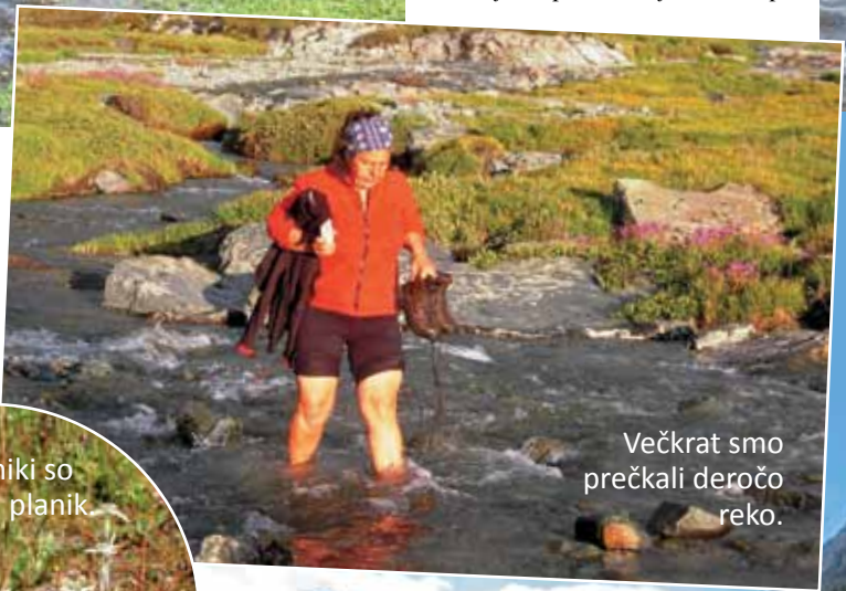
Večkrat smo prečkali deročo reko.