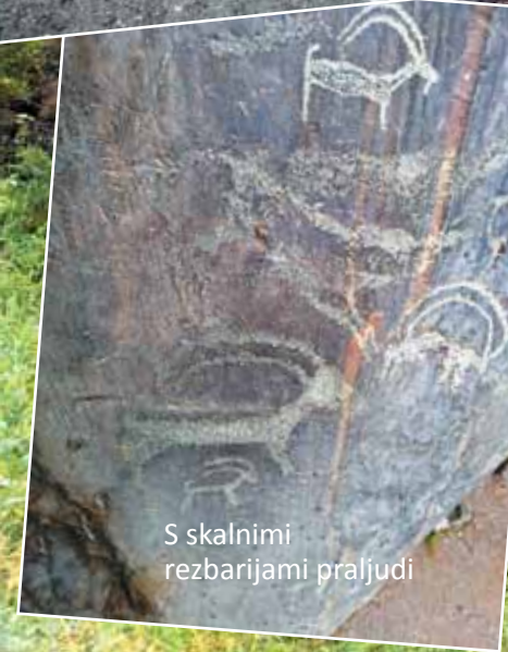
S skalnimi rezbarijami praljudi

zovanju čudovite preproge gorskih rož vsenaokrog, živalic, podobnih vevericam, ki so se, ko se je vse umirilo, prikazale iz svojih brlogov, v ležanju na vročem šamanskem kamnu, pitju vode iz gorskih izvirov,