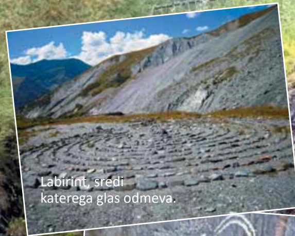
Labirint, sredi katerega glas odmeva.