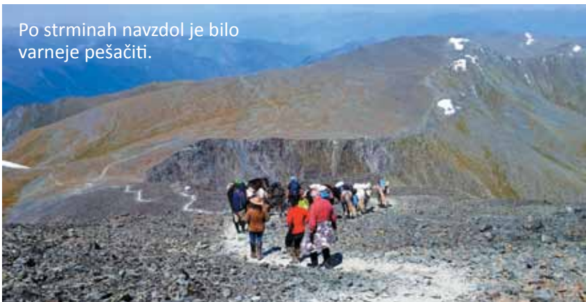
Po strminah navzdol je bilo varneje pešačiti.

žgalo sonce, zdaj bičal mrzel veter in hladile kaplje dežja. Po strmini na drugi strani prelaza smo se spuščali peš, na konjih bi bilo prenaporno in preveč nevarno. Pot navzdol se je vlekla v neskončnost, saj je naš vodnik Arkadij ocenil, da se bliža slabo vreme, zato smo morali prehoditi večji kos poti od prvotno