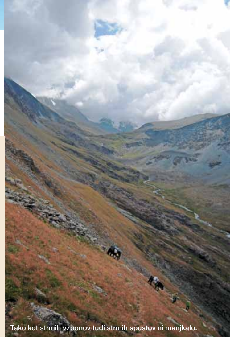
Tako kot strmih vzponov tudi strmih spustov ni manjkalo.

Neprespane noči so začele terjati svoj davek, saj je bilo nadaljevanje poti proti reki Tekelju precej naporno. Sprva močvirni teren je postajal čedalje bolj kamnit in strm, vstopali smo v svet