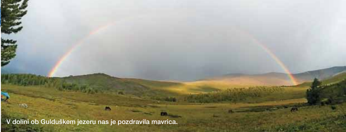
V dolini ob Gulduškem jezeru nas je pozdravila mavrica.