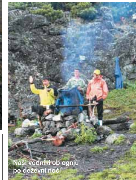
Naši vodniki ob ognju po deževni noči