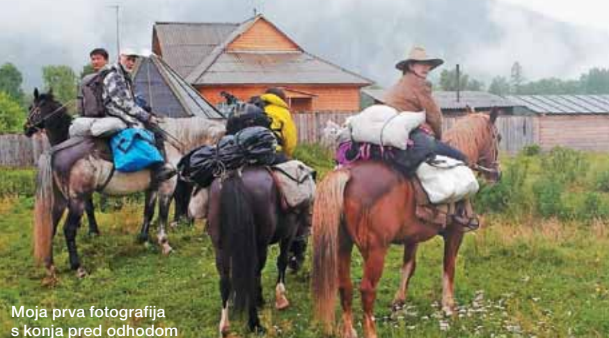
Moja prva fotografija s konja pred odhodom

nila lepo vreme in prijetno pot. To je bilo pomembno, saj odpravi leto pred nami ni uspelo priti do načrtovanega cilja. Po intenzivnem predavanju o materi Zemlji, moči altajskih svetih mest, tradicionalnem zdravljenju, vodi in soncu, ki Altajcem predstavlja mater, je vsakemu od nas na štiri oči naklonila še nekaj svojih uvidov v življenjsko pot in poslanstvo.