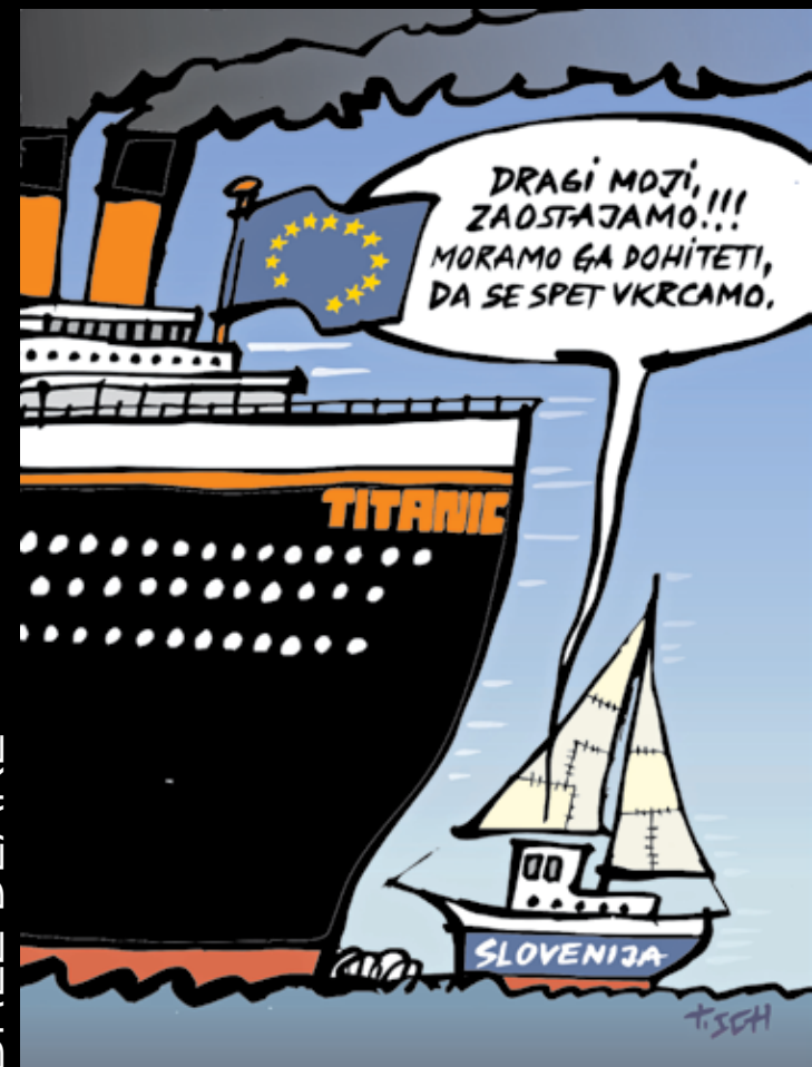
KARIKIRA: TOMAŽ SCHLEGL