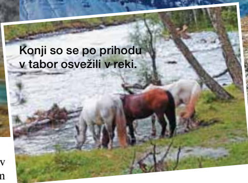
Konji so se po prihodu v tabor osvežili v reki.