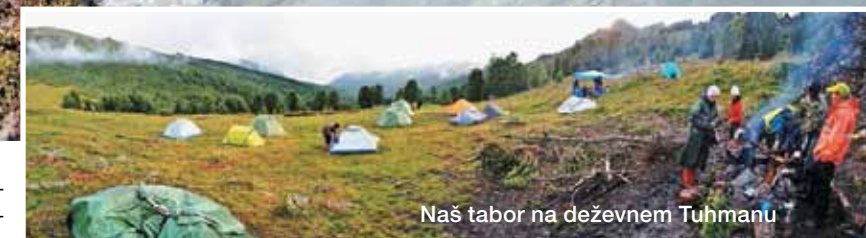
Naš tabor na deževnem Tuhmanu

Proti Kučerli. Cilj našega potovanja je bilo območje pod najvišjo altajsko goro Beluho (4506 m), ki ga Altajci imenujejo vrata bogov.