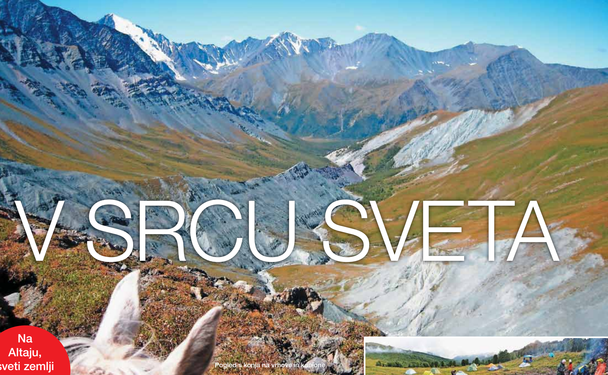
Pogled s konja na vrhove in kanjone