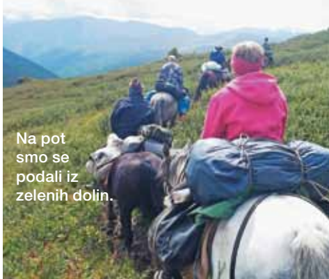
Na pot smo se podali iz zelenih dolin.

pin v gore, sicer pa je njegova družina, tako kot druge v vasi, v glavnem samozadostna – na vrtni z rodovitno črno prstjo v kratkem sibirskem poletju pridelajo veliko krompirja, pese, korenja, peteršilja, buč, celo majhne lubenice in dišavnice. Imajo tudi nekaj tovornih konjev, kravo, ki daje mleko, le žito tam ne uspeva in ga kupujejo. V vasi so tudi trgovina, vrtec, šola in zdravstvena postaja. Altajske družine so zelo povezane, člani si med seboj pomagajo, pogosto živijo skupaj po tri generacije. Hiše so lesene, novejše imajo pogosto barvasto